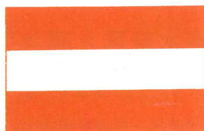
海 援 隊 旗