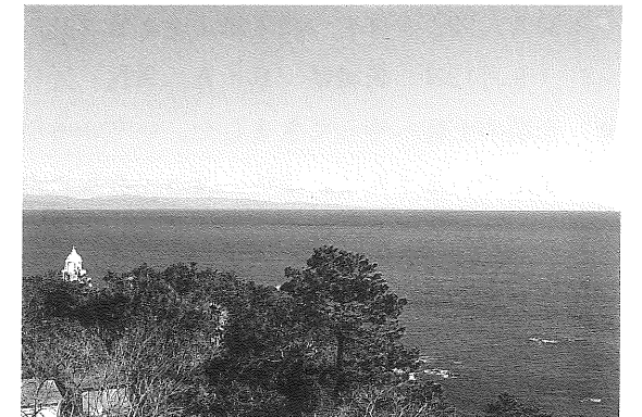
▲当館屋上から見る太平洋。左は桂浜灯台。

馬に紛装した若い男性や、1時間も2時間も展示やビデオをご覧になっているし、年配の女性、何回も来館して下さる方々もいらっしゃいますが、そんなお客様に出会うと、ホット安心し、龍馬ファンのみなさんのために、もっと良い記念館にしたいと強く思います。眺望も美しい当坂本龍馬記念館へ是非お越し下さいませ。お待ちしております。