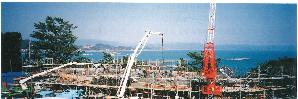
▲ 当館屋上より改築工事中の国民宿舎「桂浜荘」を望む（平成7年2月オープン予定）

「龍馬への入口」が私どものキャッチフレーズですが、龍馬のような「豊かな人間関係を作る入口」でもありたいと思います。初心を忘れず努力することは勿論ですが、そのための組織作りも今年度の課題です。ご支援下さい。