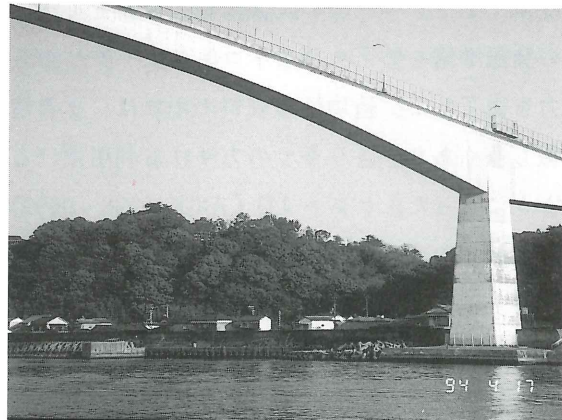
▲ 種崎より浦戸城址を望む。

天正16年(1588)、元親は居城を岡豊(南国市)から大高坂(現在高知城のある所)に移す計画を立てたが、大高坂周辺が低湿で、大雨の時は鏡川、久万川等の河川がすぐ氾濫するため、城下町の建設が極めて困難であった。そこで止むを得ずこの計画を断念し、浦戸のこの地に築城することになった。