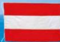
海援隊旗(二重きの旗)