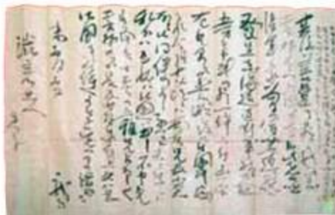
高知初公開 (写真1) 慶応元年閏5月5日付渋谷彦助宛龍馬書簡 (鹿児島県歴史資料センター黎明館蔵 玉里島津家資料)。展示期間は11月5日(土)~12月4日(日)。

今年、平成28年(2016)は、龍馬や慎太郎らの尽力によって薩長同盟が成立した慶応2年(1866)から150年目にあたる節目の年である。龍馬の功績のひとつに数えられる薩長同盟であるが、薩長同盟とはいったい何か。来年は暗殺150年、また龍馬記念館もリニューアルのための休館に入り、大きな転機を迎えるなか、この課題に展示を通して取り組む。