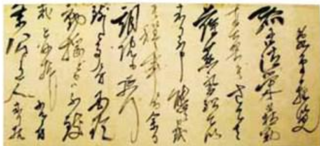
(写真2) 慶応元年閏5月17日付広沢藤右衛門・前原彦太郎宛桂小五郎書簡・部分(当館蔵)