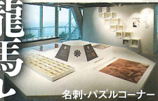
名剣・ハズルコーナー