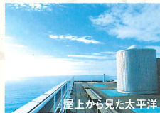
屋上から見た太平洋