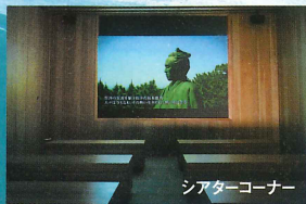
シアターコーナー