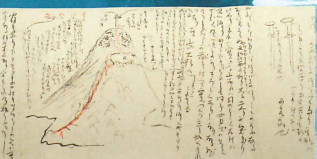
龍馬書簡 姉乙女宛(複製)