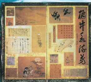
血痕のついた貼交屏風(複製)