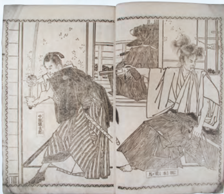
『汗血千里駒』(明治16年)の挿絵に描かれた 慎太郎と龍馬 山崎年信画