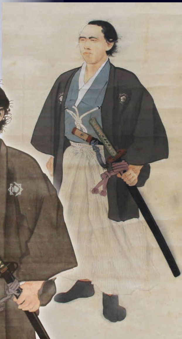
公文菊僊画 坂本龍馬肖像 (当館所蔵)