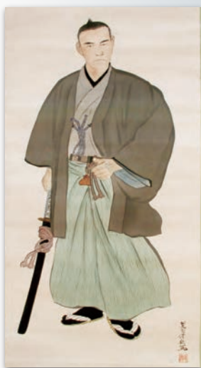
公文菊僊画 勝海舟肖像 (坂本ツル氏所蔵)