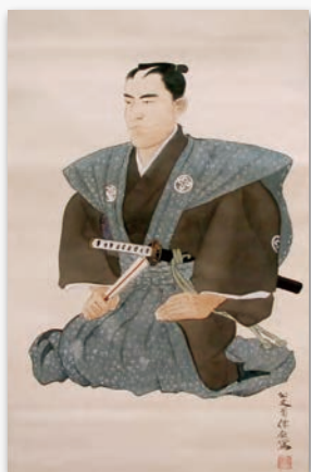
公文菊僊画 武市半平太肖像 (坂本ツル氏所蔵)