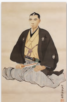
公文菊僊画 間崎滄浪肖像 (中岡慎太郎館所蔵)