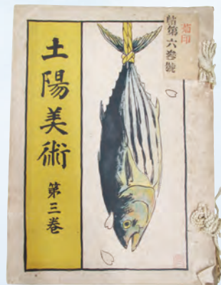
『土陽美術 第三巻』表紙 絵は石川寅治 (高知県立高知城歴史博物館所蔵)