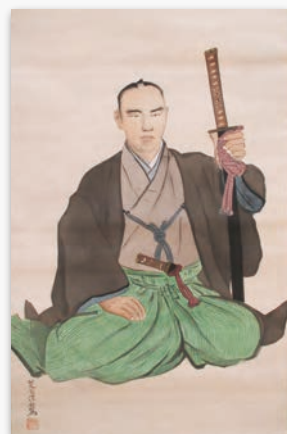
公文菊僊画 桂小五郎肖像 (坂本ツル氏所蔵)