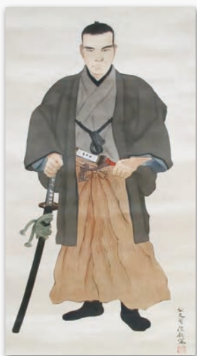
公文菊僊画 中岡慎太郎肖像 (坂本ツル氏所蔵)