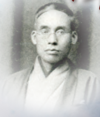
公文菊僊